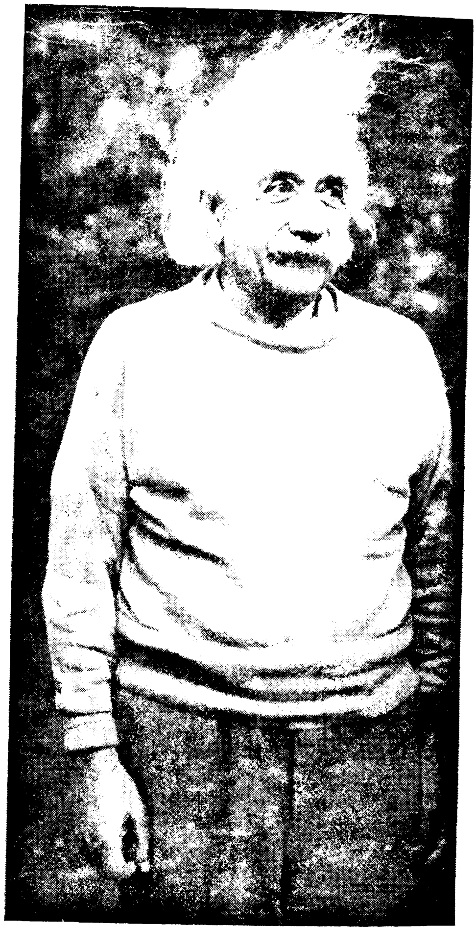
پروفیسور آلبرٹ اینسٹین